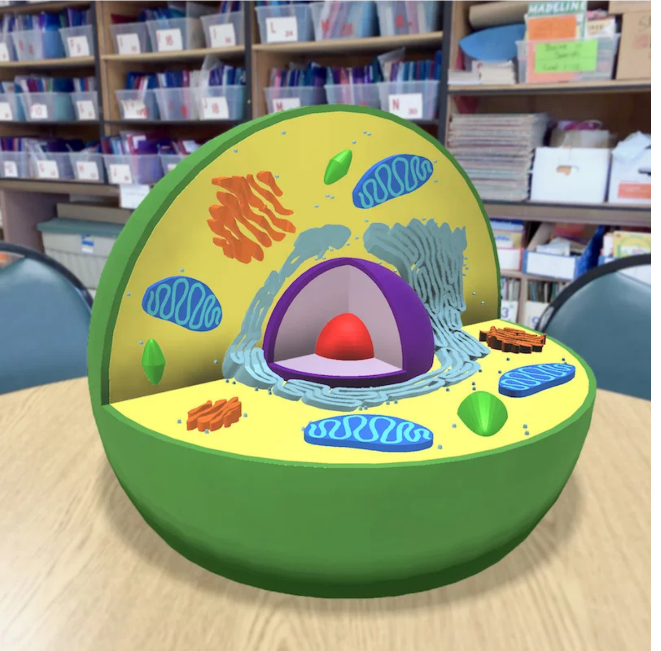
AR ortamında bir hücrenin kesitini gösteren 3B model

Yüksek çözünürlüklü ekranı ve kamerasıyla AR dünyası için benzersiz özellikler sunan iPad ile arttırılmış gerçeklikle denemeler yapabilirsiniz. Modellediğiniz herhangi bir tasarımı gerçek dünyadaymış gibi görüntüleyebiliyorsunuz. Örneğini aşağıdaki resimde görebilirsiniz.