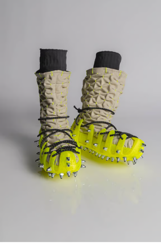
Madeline Helt'in 3D baskılı botu. (Resim: Bry Aquino)

yönelik bilinçli adımların öyküsünü yazıyorlar.