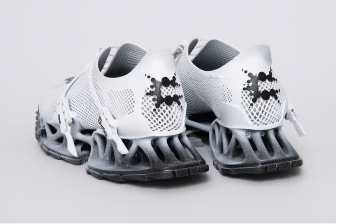
Cryptide One – tek bir parça olarak 3D baskı. (Resim: Kai Knoerzer)

Cryptide One', benzersiz tasarımıyla yenilikçiliği öne çıkarıyor. Üst kısmı, delikli çorap benzeri bir yapıya sahip olup, optimum havalandırma sağlarken, kullanıcının ayağının 3D taramasına göre özelleştirilebiliyor. Parçalı taban tasarımı, ayak parmağı, topuk ve topuk gibi belirli bölgelere özel destek sunarken, orta taban özel bir dallanma yapısıyla kullanıcının ağırlığına göre uyarlanmış bir yapıya sahip, bunu FEA ve topoloji optimizasyonu ile başarıyor.