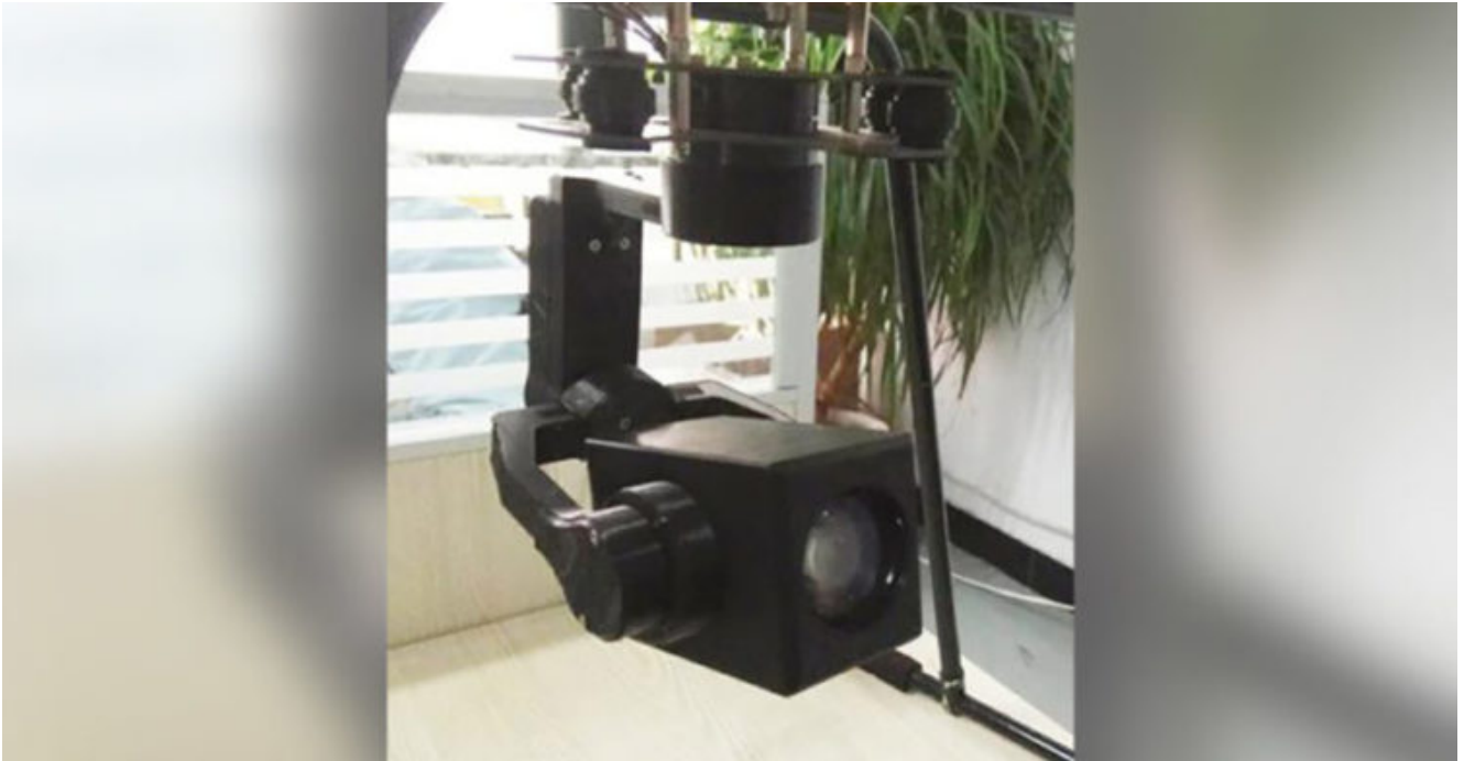
Brainy Bee UAV

karmaşık çerçeve prototipleri 3D baskı ile hızla üretilebilir. 3D baskı prototipler artık el yapımı bir prototipten daha ayrıntılı olabilir. Brainy Bee UAV 'nin geliştirilmesi sürecinde görev alan mühendislik ekibi, nihai bir ürüne benzer yapıya sahip bir 3B baskı kamera montajı aparatı oluşturdu. Ekip, 3 boyutlu baskı kullanarak kamera montaj aparatını üretmeden önce hepsi birbirine yapıştırılmış, elle kesilmiş fiber takviyeli levhalar olan kaba bir montajı doğaçlama olarak gerçekleştiriyordu. Kullanıcıların çoğu, 3 boyutlu baskı sayesinde prototip hazırlama süresinde zaman konusunda olağanüstü bir azalmaya tanık oldu.