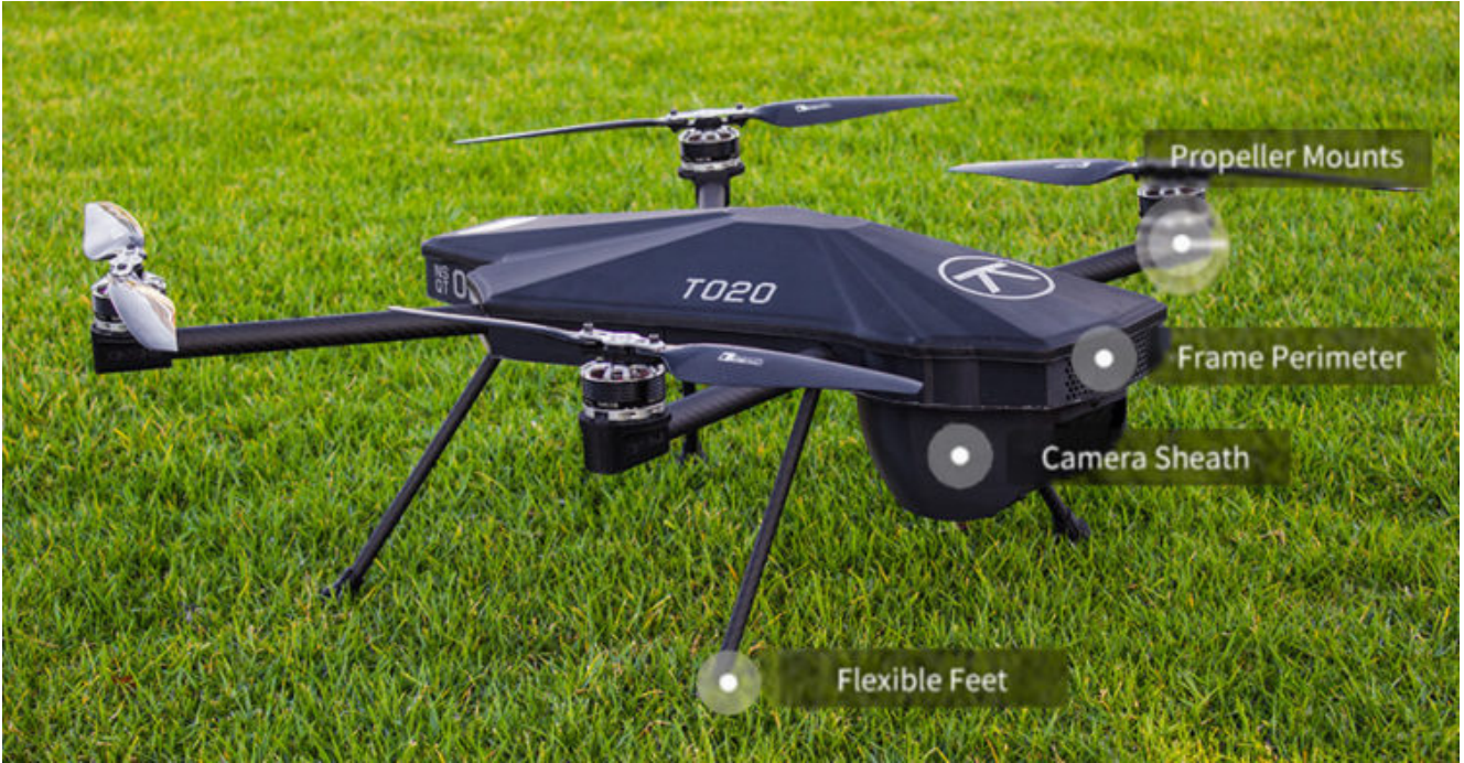
Black Bird UAV

Her bir filamentin mekanik özelliklerine bağılı olarak, 3D baskı parçalar son ürün olarak kullanılabilir. Örneğin, Nightingale Güvenlik şirketi Black Bird isimli İHA'sını her parça için farklı malzeme özellikleri gereksinimini göz önüne alarak tasarlıyor. Peki bu ne anlama geliyor? Bu adımla birlikte Nightingale Security nispeten az sayıda aylık sipariş aldığı durumlarda bu parçaların her biri için birkaç farklı kalıba yatırım yapmak yerine her parçayı ayrı işlevler için farklı bir filamentle basarak üretmeyi tercih ediyor. Örneğin, darbelere karşı en yüksek direnci sağlayabilmek için çerçeve kenarları PC filament ile basılıyor.