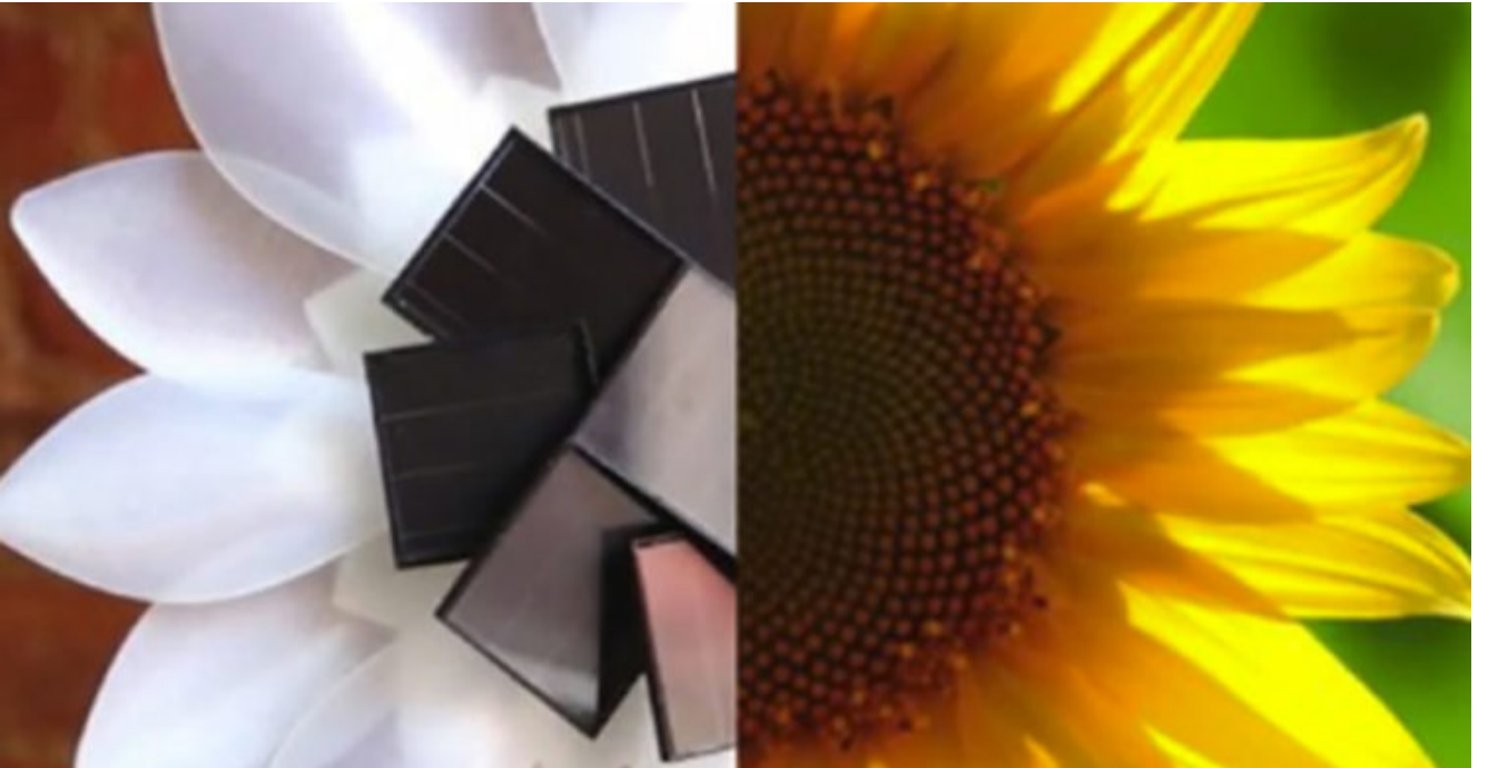
Still Alive Lights

Elektrikli ürünler için görünümlerinin kalitesinin ürünün çekiciliği için kritik olduğu aşikâr. Raise3D'nin FFF yazıcıları, endüstriyel sınıf bileşenler ve benzersiz mekanik teknoloji sayesinde yüksek baskı kararlılığı ve hassasiyetine sahiptir. 3D yazıcıların yüksek kaliteli yapısı, pürüzsüz yüzeyler ve net açılarla her boyutta ve geometride 3 boyutlu olarak yazdırılmış parçalar üretmelerine olanak tanır. Yaratıcı aydınlatmada uzmanlaşmış Still Alive Lights 'ı ele alalım. Sadece 1 mm kalınlığında taç yaprağı şeklinde bir abajur üreten ekip kalınlığı taç yaprağına belirli bir şeffaflık verecek şekilde tasarladı, bu sayede ışık her ne kadar az parlak olsa da ürünün içinden geçebiliyor.