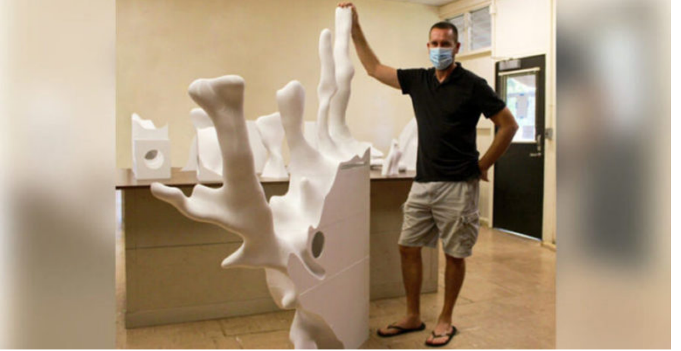
Raise3D Pro2 yazıcı ile üretilen mercan modelleri

ekolojisini görselleştirmek için üniversitenin okyanus araştırma ekibiyle iş birliği yaptı. Amaçları, halkın dikkatini mercanların yaşamına ve iklim değişikliğine çekmekti. Goebel 100'den fazla ekstra büyük mercan parçası basarak bunları bir araya getirdi. Raise3D Pro2 Plus'ın yapı hacminin 12 X 12 X 23,8 inç (305 X 305 X 605 mm) olması onu Goebel'in fiyat aralığındaki en iyi 3D yazıcı yapıyor. Bu nedenle de yaklaşık 6.000 saatlik bir çalışmaya denk gelen projeyi yazdırmak için Raise3D Pro2 Plus'ı kullandı.