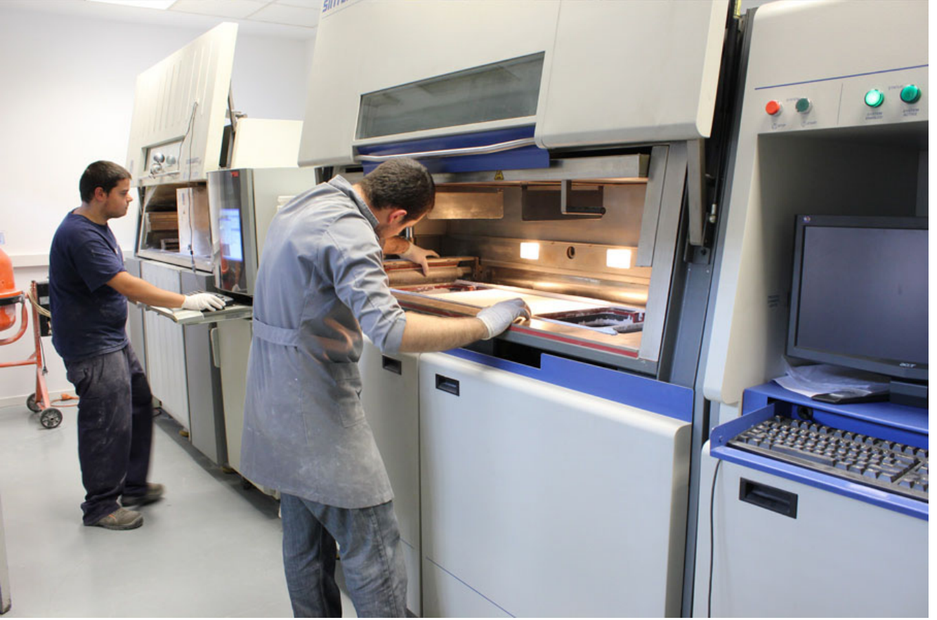
SLS üretim makinesi.