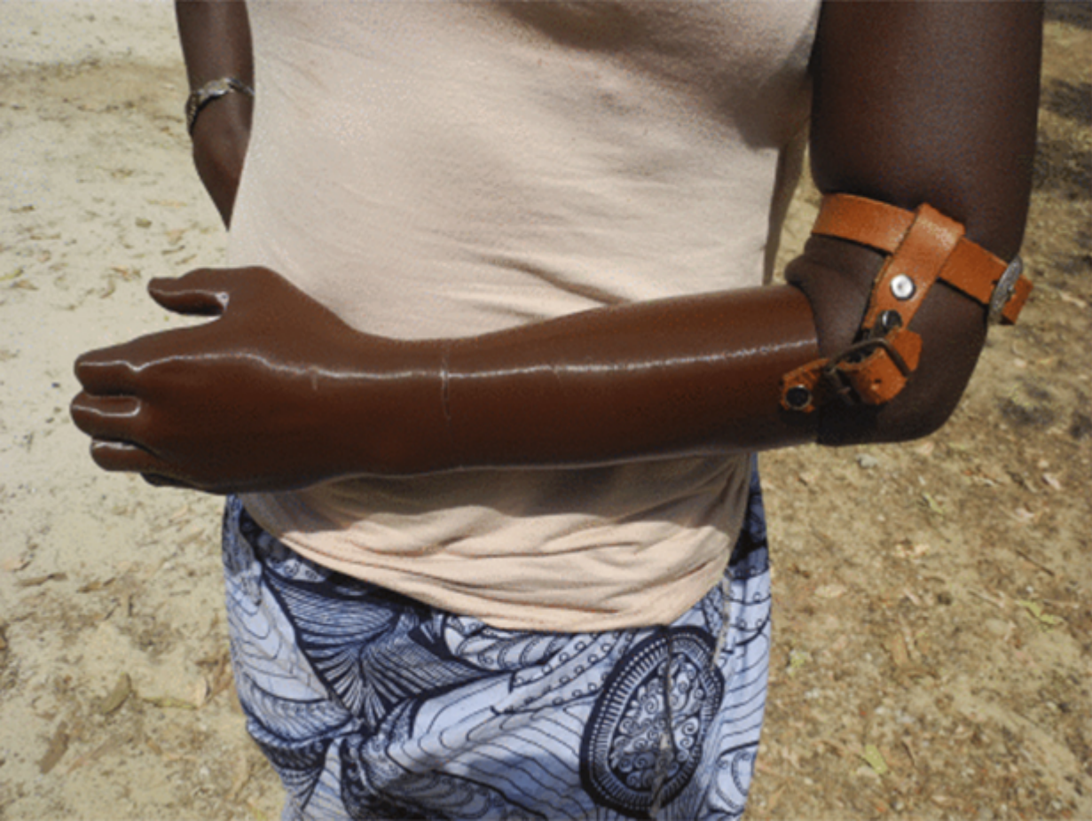
Yanıkların İyileşmesini Destekleyen Kol Atelleri