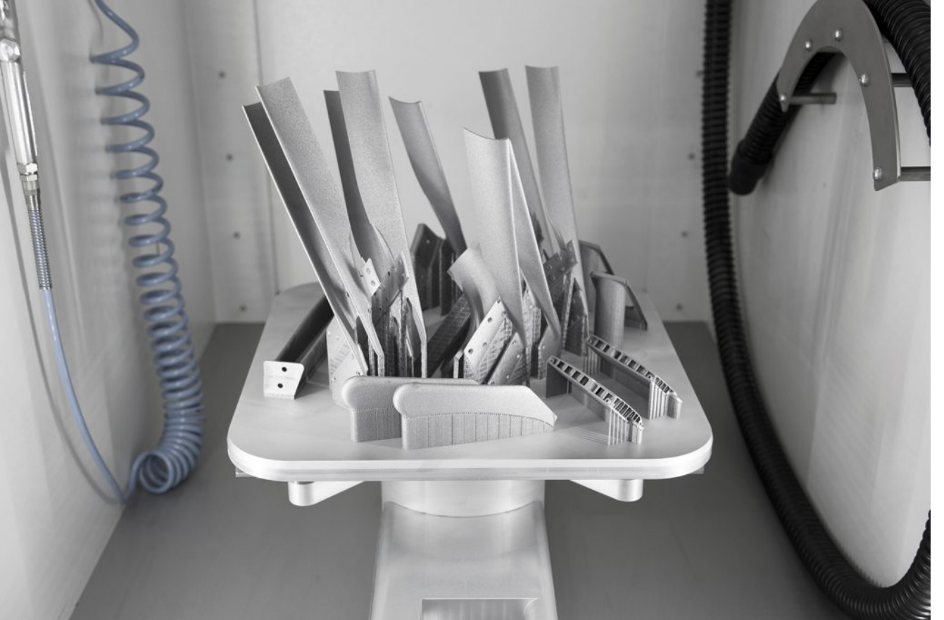
%60 F1 rüzgar tüneli modeli ve AlSi10Mg'den yapılmış 1: 1 F1 yarış arabası parçaları içeren bir baskı tablası

Hansen geleceğin teknolojilerini yakalayabilmek için çok çeşitliliğin önemli olduğuna vurgu yapıyor. Otomotiv endüstrisi Sauber'in mirası ve ana alanı olsa da, söz konusu 3D baskı olduğunda şirket ön seri ve tasarım çalışmaları için prototip oluşturmada oldukça aktif. Hatta metal baskı özelinde; ambalajlama veya uzay ve havacılık gibi çeşitli endüstrilerdeki son kullanım uygulamaları büyük fırsatlar yaratıyor.