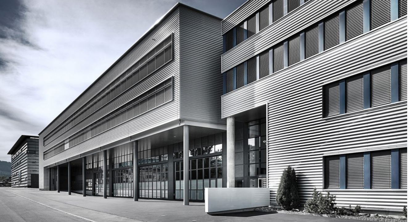
Sauber Motorsport'un Zürih, İsviçre yakınlarındaki Hinwil'de bulunan fabrikası

Başlangıçta polimer eklemeli imalat ile rüzgar tüneli testleri için prototip basan Sauber, 2007'de plastik eklemeli imalat üretim departmanını kurdu. Sauber, bu aşamada üretilecek parçalar için SLS (Seçici Lazer Sinterleme) ve SLA (Stereolitografi) teknolojilerinden yararlandı. Eklemeli imalat alanında vites artırmak isteyen şirket, 2017'de Additive Industries ile kurduğu ortaklık doğrultusunda metal 3D baskıya yatırım yaparak onar yıllık periyotlarla gerçekleştirdikleri inovatif hamlelere noktayı koydu.