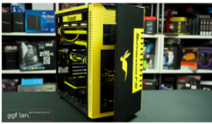
Stuart Tonks Australia