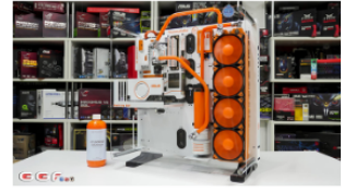
Stuart Tonks Australia