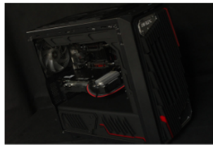
Popoy Ramdom Philippines